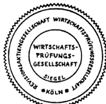
Siegel einer Wirtschaftsprüfungsgesellschaft