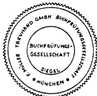
Siegel einer Buchprüfungsgesellschaft