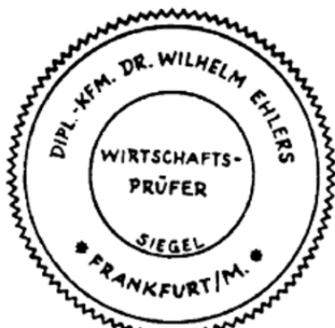
Siegel eines Wirtschaftsprüfers